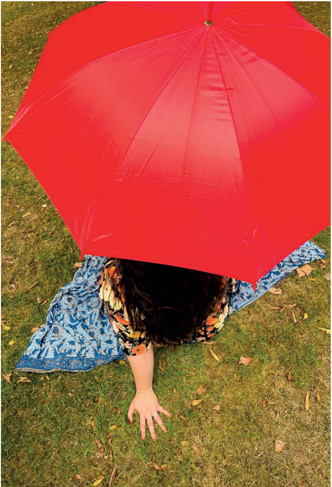
Niki onder haar rode paraplu