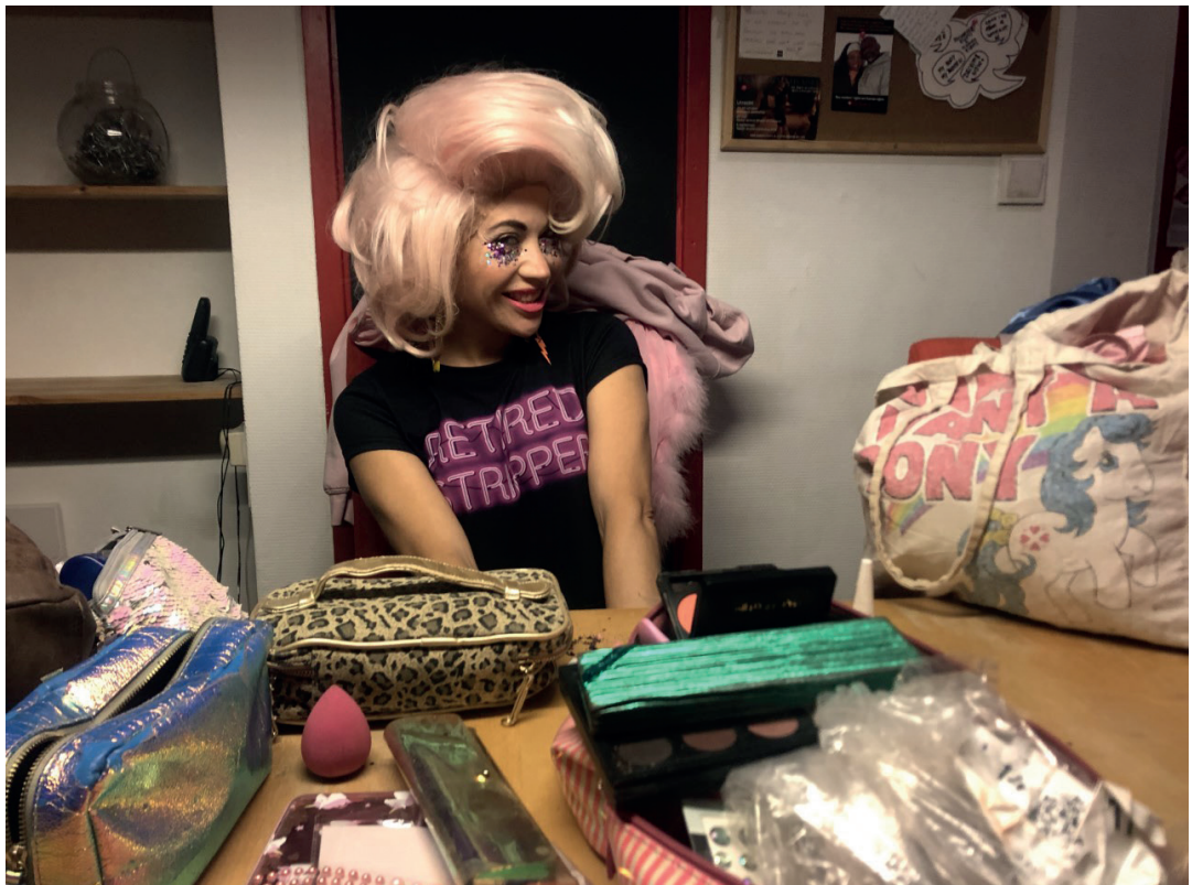
Sekswerkers van SAVE en Striptopia organiseren een liefdadigheidsbingo voor hun collega's die in financiële nood zijn geraakt tijdens de pandemie.

Legaliteit. Sekswerk is al sinds de tijd van Napoleon legaal in Nederland. Er was wel een bordeelverbod, maar dat werd in 2000 opgeheven. De tot dan toe gedoogde bordelen konden nu een vergunning van de gemeente krijgen. Toch is sinds de opheffing van het bordeelverbod ruim twee derde van de vergunde plekken verdwenen. Het beleid rondom sekswerk wordt op gemeentelijk niveau bepaald. Veel gemeenten kiezen er voor om individuele sekswerkers aan dezelfde regels te toetsen als seksinrichtingen zoals bordelen en seksclubs. In de praktijk is het daarmee voor een individuele sekswerker vrijwel onmogelijk om zelfstandig thuis of als escort te werken. Individuele