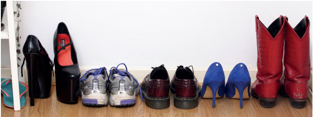
Herkenbare beelden voor en door sekswerkers van RedInsight.org.

Bij een live uitzending kan er niet in worden geknipt, je weet dan dus precies wat er de wereld in wordt gezonden. Maar je kunt ook met onverwachte vragen of situaties te maken krijgen, daar moet je mee om kunnen gaan. Zo doen er mogelijk opeens onverwacht tegenstanders van sekswerk mee aan een gesprek. Wees er dan van verzekerd dat jij altijd meer verstand hebt van het onderwerp en dat jouw geleefde ervaringen zwaarder wegen dan hun mening.