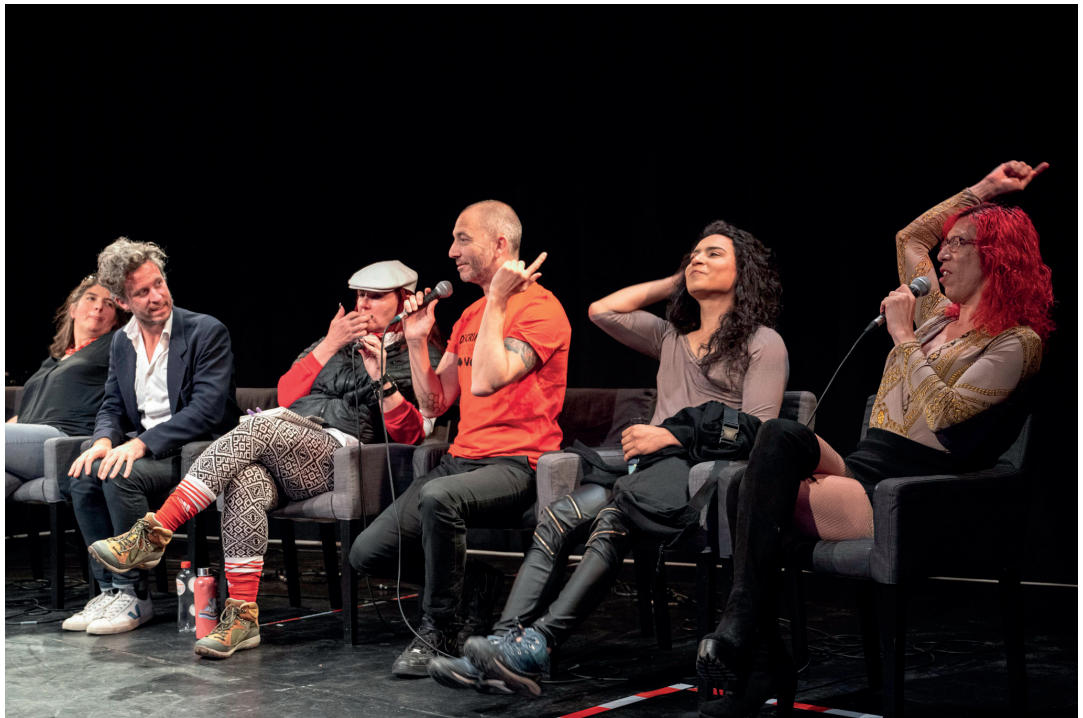
Sekswerkerspanel tijdens het door sekswerkers georganiseerde Whore Arts & Politics festival Snap! 2023 in Brussel (België).

der. Dit noemen we de 'hoerarchie' en het klinkt vaak als 'ik werk dan wel als erotische tantramasseur, maar ik sta in ieder geval niet achter het raam' of 'ik heb dan wel seks met mensen op een kamer maar ik sta in ieder geval niet naakt voor jan en alleman op het internet'. Journalisten zelf kijken soms ook verschillend naar werken voor de online redactie van een commerciële zender en de researchredactie voor een achtergrond-documentaire bij een publieke omroep. Terwijl ze wel allemaal met dezelfde elementen werken. Voor sekswerk geldt wel dat hoe minder aanzien een bepaalde werkvorm heeft, hoe meer last die sekswerkers van stigma en vaak ook geweld hebben. Probeer als mediamaker én als sekswerker dus te voorkomen dat je hieraan bijdraagt.