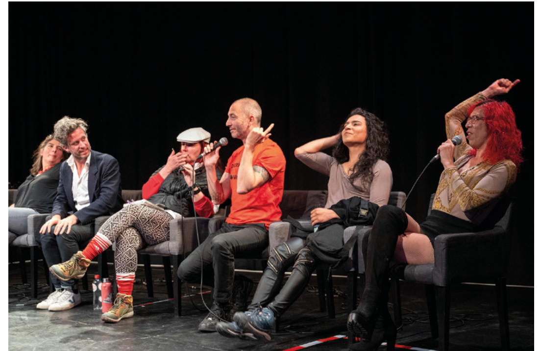
Seksworkerspanel tijdens het door sekswerkers georganiseerde Whore Arts & Politics festival Snap! 2022 in Brussel (België).

Stigma op sekswerk maakt ook dat niet alle sekswerkers zichzelf als sekswerker zullen omschrijven. Of dat ze geneigd zijn taal te gebruiken die de ene vorm van sekswerk ‘minder erg’ maakt dan de an-