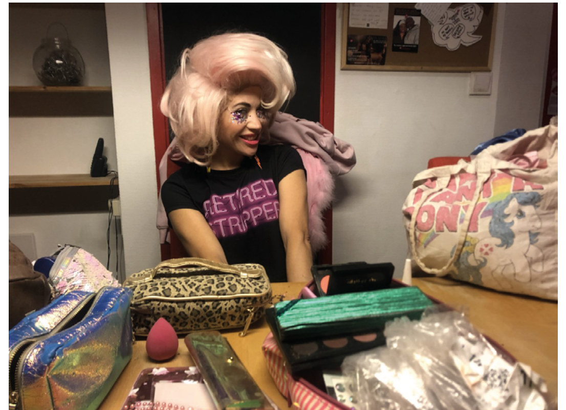
Sekswerkers van SAVE en Striptopia organiseren een liefdadigheidsbingo voor hun collega's die in financiële nood zijn geraakt tijdens de pandemie.

Legaliteit. Sekswerk is al sinds de tijd van Napoleon legaal in Nederland. Er was wel een bordeelverbod, maar dat werd in 2000 opgeheven. De tot dan toe gedoogde bordelen konden nu een vergunning van de gemeente krijgen. Toch is sinds de opheffing van het bordeelverbod ruim twee derde van de vergunde plekken verdwenen. Het beleid rondom sekswerk wordt op gemeentelijk niveau bepaald. Veel gemeenten kiezen er voor om individuele sekswerkers aan dezelfde regels te toetsen als seksinrichtingen zoals bordelen en seksclubs. In de praktijk is het daarmee voor een individuele sekswerker vrijwel onmogelijk om zelfstandig thuis of als escort te werken. Individuele