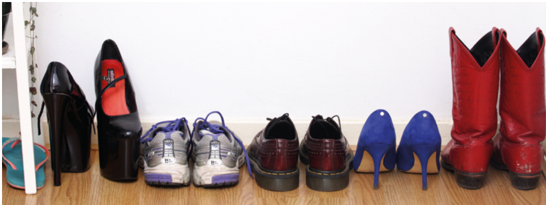
Herkenbare beelden voor en door sekswerkers van RedInsight.org.

Bij een live uitzending kan er niet in worden geknipt, je weet dan dus precies wat er de wereld in wordt gezonden. Maar je kunt ook met onverwachte vragen of situaties te maken krijgen, daar moet je mee om kunnen gaan. Zo doen er mogelijk opeens onverwacht tegenstanders van sekswerk mee aan een gesprek. Wees er dan van verzekerd dat jij altijd meer verstand hebt van het onderwerp en dat jouw geleefde ervaringen zwaarder wegen dan hun mening.